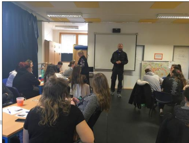
beseda s HIV+ lektorem

Dotazníkové šetření o spokojenosti se seminářem (1-5 na pětibodové škále – 1 nejlepší)