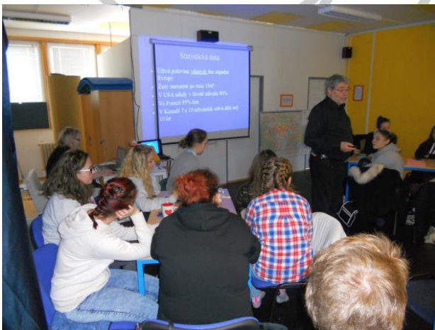
ochutnávka dalších témat (antikoncepce)